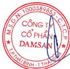
Vũ Huy Đông Chủ tịch Hội đồng quản trị