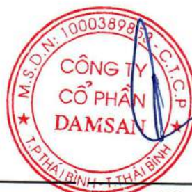
Vũ Huy Đông Chủ tịch Hội đồng quản trị